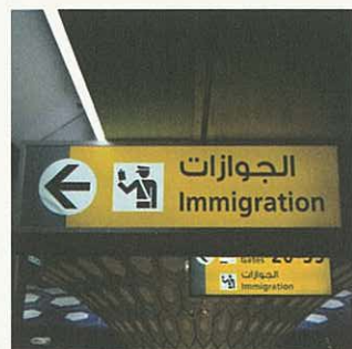
Boven: Bewegwijzering Schiphol Onder: Bewegwijzering Abu Dhabi luchthaven

Boven: Spread uit 'Visual Function' Onder: Spread uit 'Wegwijs op Schiphol'